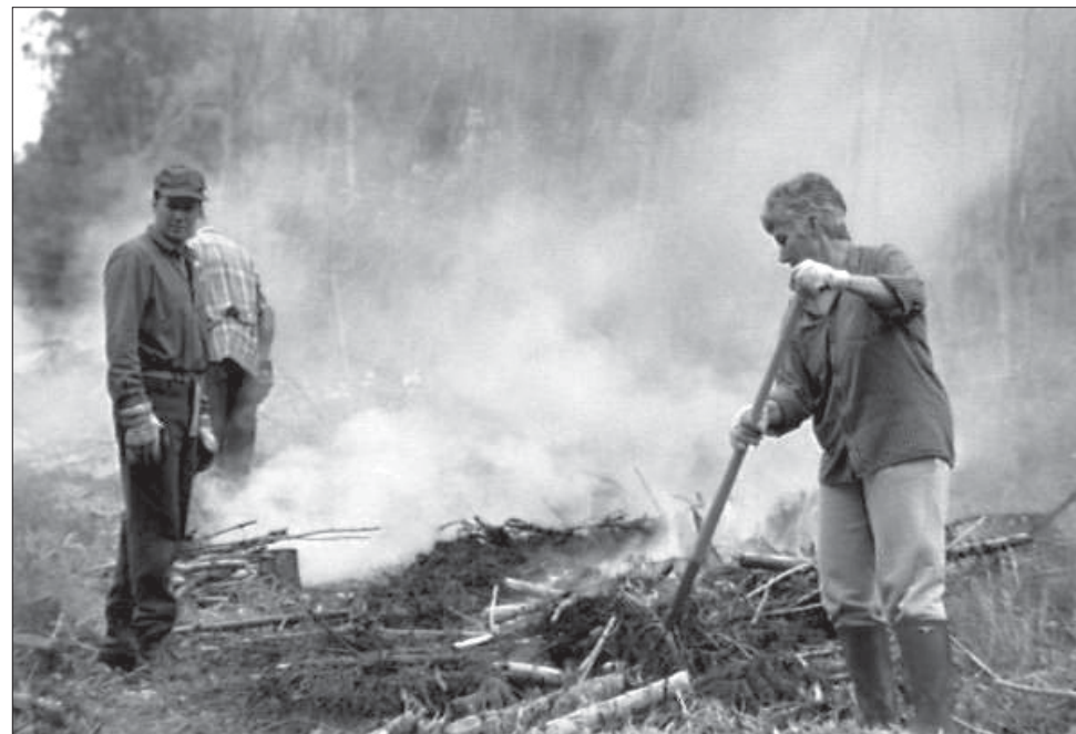
Källslätten 1996. (Se notis på s.9)

Nästa FINNSAM-info kommer i juni. Manusstopp 25 maj.