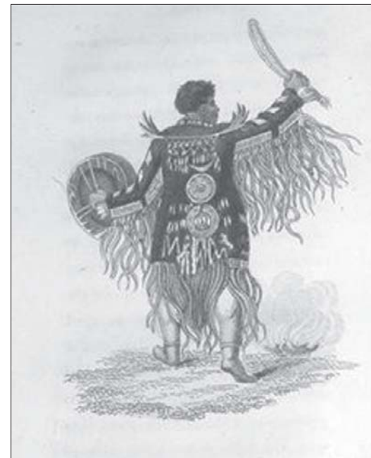
En tungusisk schaman.

om en gubbe i Östmark, som stämde vargarna från trakten med följande ord: ”Nu kommer I inte tepaka, se länge tänran setter i käkpenan men” (Nu kommer I inte tillbaka, så länge tänderna sitter i käkbenen på mig).